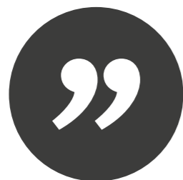
PERE CARNEADO RAICH DIRECTOR "la Caixa"

La preparación de casos y ejercicios así como el trabajo en equipo exigen asumir el compromiso de una importante dedicación. Los participantes deben implicarse en las situaciones planteadas en las sesiones formativas para garantizar la buena marcha del programa y el éxito del mismo. La adquisición de estas competencias permite a los participantes adquirir conductas de liderazgo eficaces.